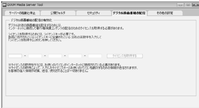
「デジタル録画番組の配信」のライセンスキー入力画面

その際に、下記のライセンスキーを入力してください。 詳しくは、添付のマニュアルをご覧ください。